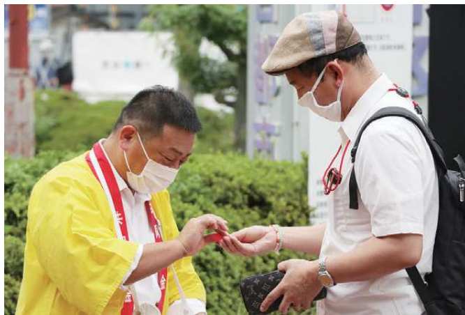
▲寄付者に赤い羽根を渡す亀田社協会長(大和八木駅前)