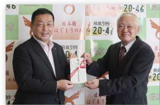
▲亀田会長(市長)に寄付金を手渡す同クラブの森本会長(右)