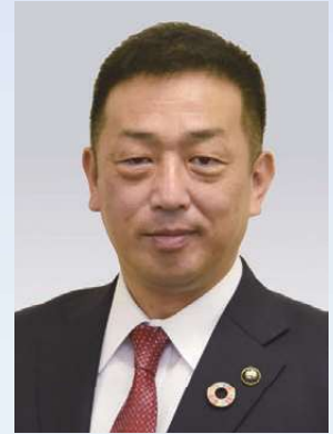
檀原市社会福祉協議会