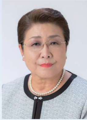
檀原市共同募金委員会

新しい年が皆様にとって良き年となりますよう祈念し、新年のご挨拶とさせていただきます。