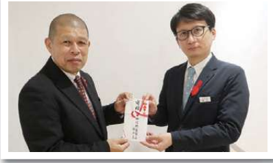
職域募金として、社員の皆さんにご協力いただくとともに、百貨店前を街頭募金活動の場所としても提供いただきました。(写真右)