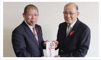
平成17年度から共同募金にご協力いただいています。本年度も多額のご寄付をいただきました。(写真右)