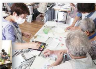
▲夏のうちわづくり(晩成)