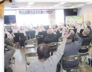
▶クリスマスソングで体操(鴨公)