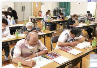
▲色鉛筆を使ってめり絵(今井)

ふれあいサロンは、地域での65歳以上の方の“集いの場”です。介護予防の一環として、各地区公民館など市内12カ所で感染症対策を講じて実施されています。軽スポーツや、手芸・工作、映画鑑賞など多くのメニューがあり、参加者は「友達づくり」や「おしゃべり」、「サロンのお手伝い」など、自分に合った楽しみ方を見つけられています。皆さんも、サロンに来てみませんか?詳しくは、地域福祉係までお問い合わせください。