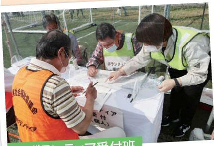
● ボランティア受付班

全国から駆けつけるボランティアに申込手続きやボランティア保険加入の確認を行います。