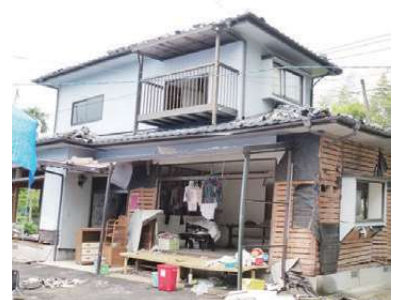
※写真は被災イメージです。